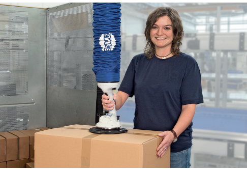
Logistik / Distribution