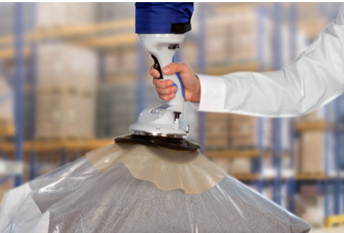
Chemie / Lebensmittelindustrie