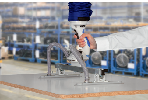
Metallbau / Maschinenbau